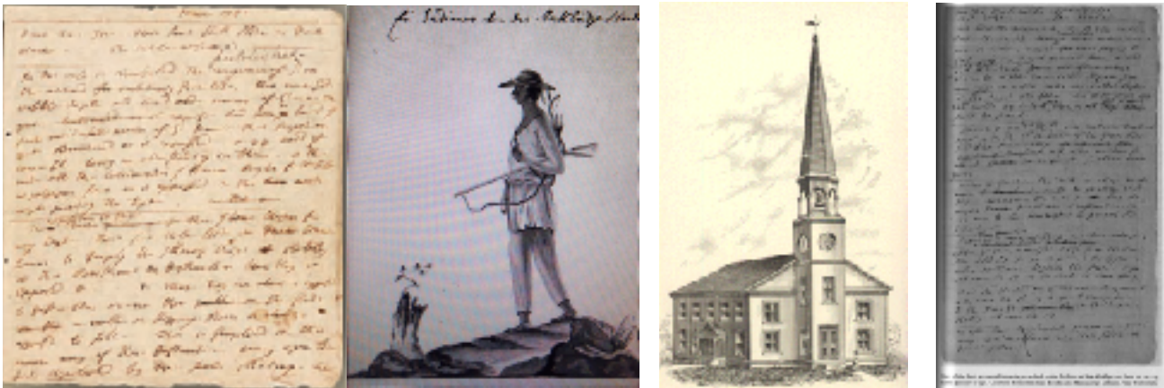
Figura 05: Desenho de uma aldeia Housatonic (Shekomeko) em 1745

Figura 04: Rascunho do possível primeiro sermão em Stockbridge