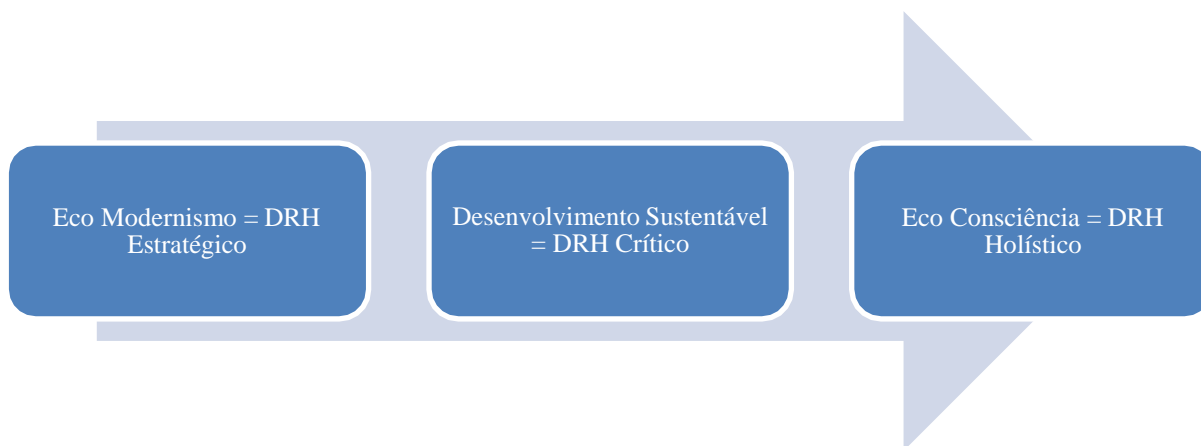
Figura 1: Evolução do DRH conjuntamente com a ideologia sustentável

Outro autor que contribui para pensar essas relações é Kuchinke (2010), que tal qual Russ (2012), também vai compreender Desenvolvimento Humano como Sustentabilidade. Kuchinke (2010) reforça a ideia de que o papel da aprendizagem pautada no florescimento humano é fundamental para o crescimento de negócios sustentáveis nas empresas. E que o florescimento humano deve e pode guiar os valores das práticas de DRH. Encerra ainda que Desenvolvimento Humano tem uma profunda fundamentação ética e filosófica que desafia a prática de DRH, porque implica em trabalhar em prol da ampliação de suas fronteiras de atuação para além do indivíduo e do processo de trabalho imediato. Incorpora ideários acerca do desenvolvimento de sociedades e nações, ampliando a gama de resultados desejáveis pelas organizações. Neste sentido, sua atuação teria o papel de agir não somente a serviço de uma pessoa, grupo/equipe ou em benefício da própria organização, mas também da comunidade, nação ou até mesmo toda humanidade. Desenvolvimento, neste contexto, implica para este autor que pelo menos uma parte do ganho seja direcionada para o bem público e não só individual. Enfim, DRH nas organizações teria como papel aumentar o compromisso profissional nesta direção. Pode se então conceber a evolução do DRH, conforme a evolução da ideologia em Sustentabilidade, conforme a Figura 1: