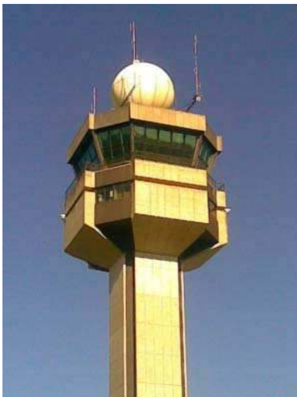
Figura LXVI – Radar de Superfície do Aeroporto Internacional de São Paulo / Guarulhos com protetor de configuração geodésica. Foto: Maria Cristina Romaro, 2007.

37. Plano Diretor do Aeroporto de Guarulhos, PD 1 – Sumário. Ministério da Aeronáutica, 1981.