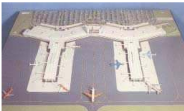
Figura LXVII – Simulação dos terminais de passageiros previstos através da maquete original.

Considera-se que as vantagens deste tipo de distribuição horizontal são quanto aos embarques e desembarques, pois esta configuração proporciona um maior número de aeronaves e posições de estacionamento das mesmas, em torno de toda a sua extensão.